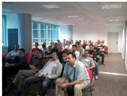
Posjećenost startup srijede